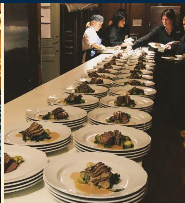
Det bjöds bl a på helstekt hjort med enbärsgräddsås och ljummen sallad på brusselskål och grönkål.