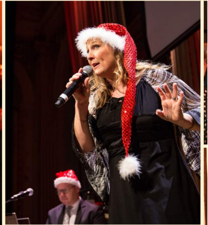
My Olsberg var strålande som artist och konferencier.