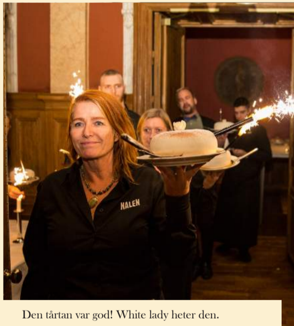
Den tårten var god! White lady heter den.