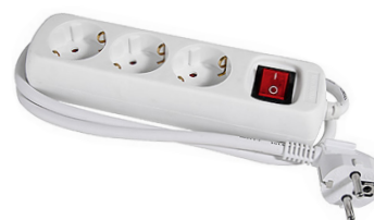
Grendosa med strömbrytare är ett elspartips.

– Täck inte elementen med möbler och tunga gardiner. Värmen måste kunna cirkulera i rummet. Stora möbler och tunga gardiner som går ner till golvet kan hindra cirkulationen.