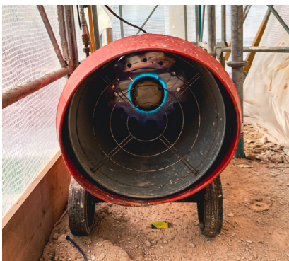
Värmarna är nödvändiga nu när det är kallt.

Nu undrar kanske någon varför de stora fläktarna står där och kör hela tiden. Jo, det är för att hantera en av utmaningarna så här års med att lägga puts – vädret.