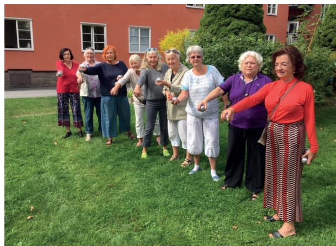
I våras startades en boulegrupp i Vasastan.