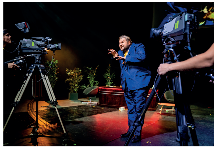
Verdis opera Falstaff på Malmöoperan är förflyttat till nutid. Se den live hemma i soffan.

Kanske lyssnar du redan på någon podd. Det vill säga ett slags radioprogram som kan spelas in av vem som helst och sedan sändas via internet. Du kan lyssna på din mobil eller på dator. Idag finns det en uppsjö av poddar på olika teman, bland annat dessa: