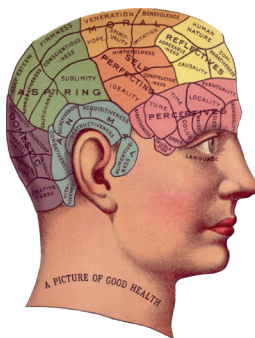
Hjärnan behöver stretchas emellanåt.

Många känner motstånd inför att tänka nytt, det kräver lite mer energi och är vi rädda, deppiga eller trötta så leder det ofta