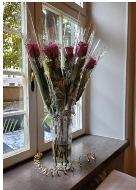
Alla jubilarer fick den traditionsenliga långstjälkade rosen att ta med hem.