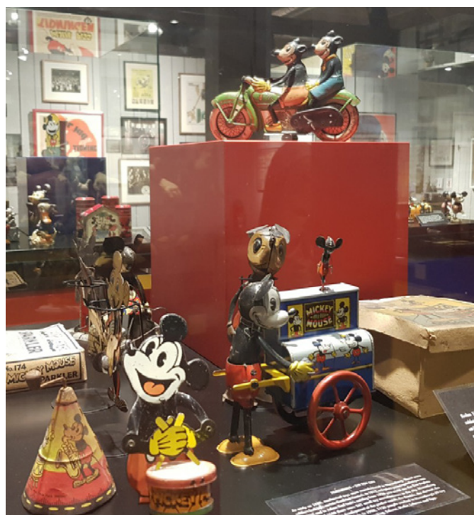
Motorcykeln med Musse piggs och Mimmi från 1929 har ett värde på 1,7 miljoner, om man räknar med originalförpackningen.