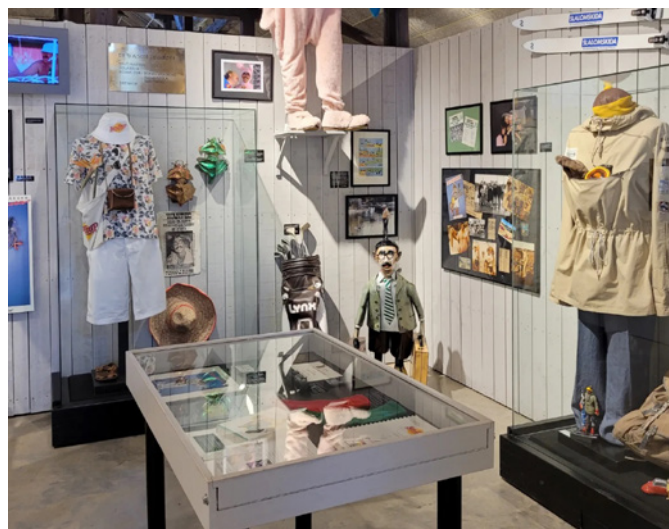
Det fanns också ett rum med rekvisita från filmerna med Stig Helmer.