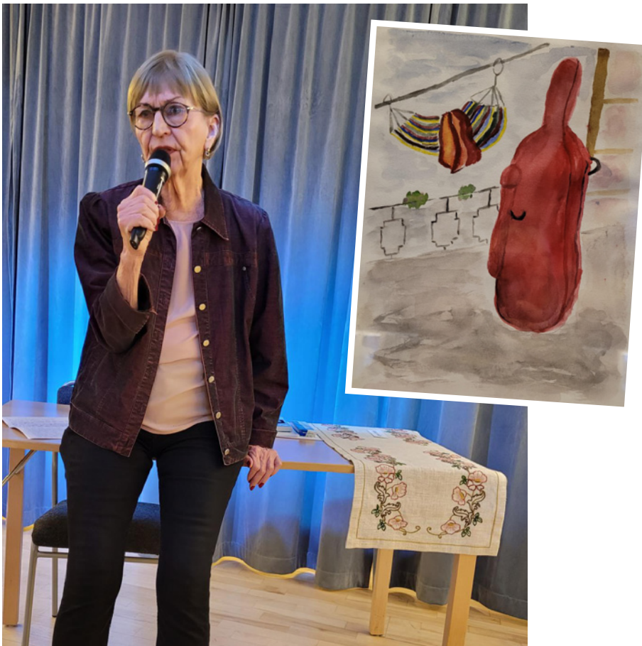
Tiula kåserade om en basfiol som hittades i Stiftelsens trädgård. Hur var det nu, fanns det verkligen ett hemligt lönnfack i den? Kanske får vi höra mer om basfiolen nästa vårsalong.

Konst ska beröra och det gjorde den här vårsalongen med besked.